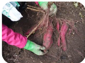
今年も芋洗い機 活躍しました！