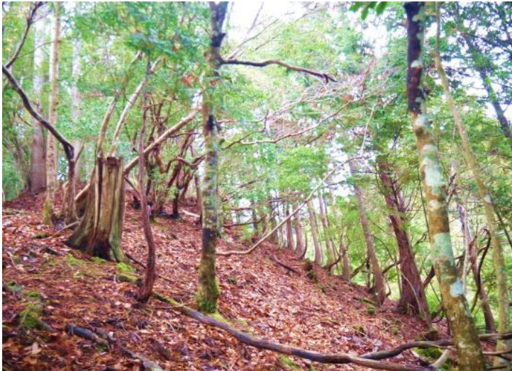
100年以上手の入っていない極相の様子

そこで、京都は五月の葵祭に不可欠なフタバアオイの植栽をカンアオイの自生地近くに試みたところ、適地なのか年に倍々の増殖ぶりです。他所でもフタバアオイの増殖をされていると聞きますが、こちらは全くの手間いらずで栽培できているので、さらに規模を広げようと考えています。また、クマザサ（チマキザサ）も鹿による食害や十数年前の花脊を含む百井などチマキザサの供給地での一斉開花によりほとんどが絶滅してしまいましたが、最近やっと一部が復活し始めたので、さらに後押しすべく“来復”で土壌の有用微生物を増殖させ、その回復力を目下観察中です。