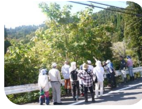
秋の花や果実を観察できました。