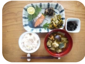
花脊の野菜たっぷり 健康的な食事でした。